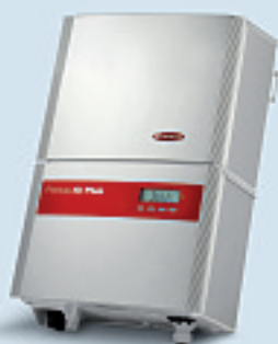
Fronius IG Plus 30 V-1 / Fronius IG Plus 35 V-1 / Fronius IG Plus 50 V-1

Stark und kompakt: Die drei Einphasengeräte mit einer Ausgangsleistung von 3 bis 4 kW eignen sich z. B. für PV-Anlagen von Einfamilienhäusern.