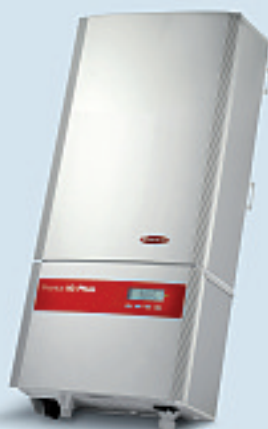
Fronius IG Plus 70 V-2 / Fronius IG Plus 100 V-2

Stark und kompakt: Die drei Einphasengeräte mit einer Ausgangsleistung von 3 bis 4 kW eignen sich z. B. für PV-Anlagen von Einfamilienhäusern.