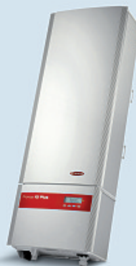
Fronius IG Plus 100 V-3 / Fronius IG Plus 120 V-3 / Fronius IG Plus 150 V-3

Die großen Brüder: Der zweiphasige Anschluss sichert eine Phasenschieflast unter 4 kVA. Die Ausgangsleistungen betragen 6,5 bzw. 8 kW.